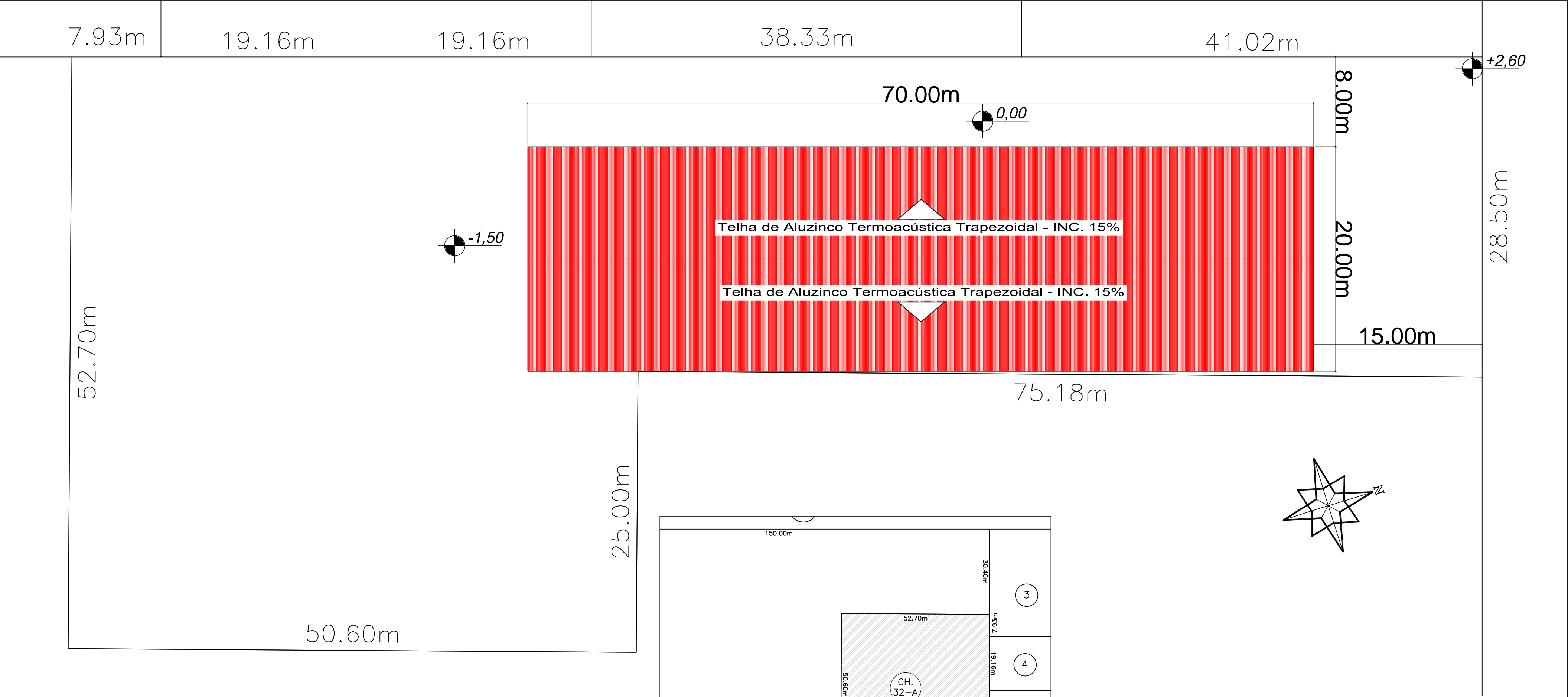
Planta De Cobertura / implantação Escala 1/250