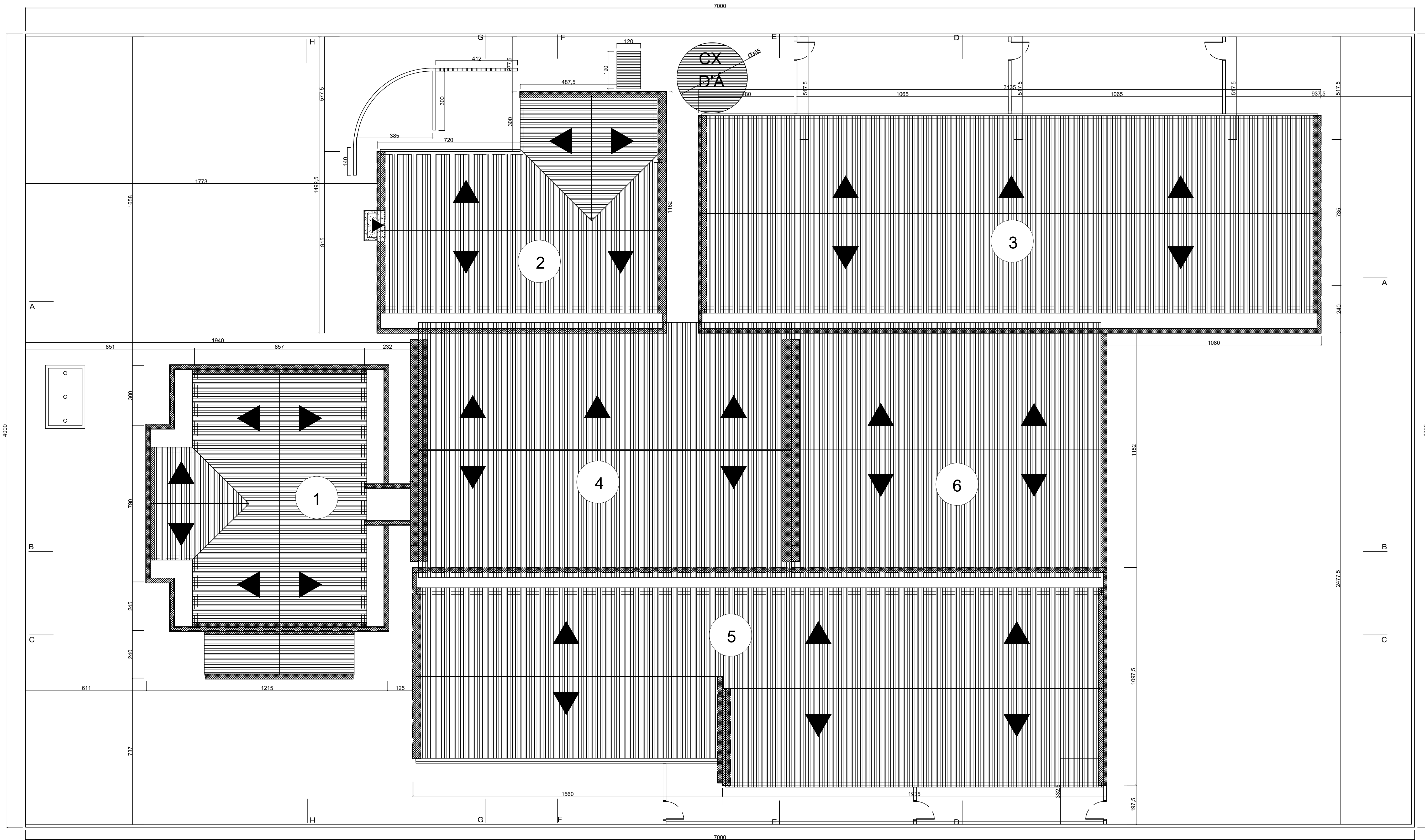
IMPLANTAÇÃO ESCALA 1/100