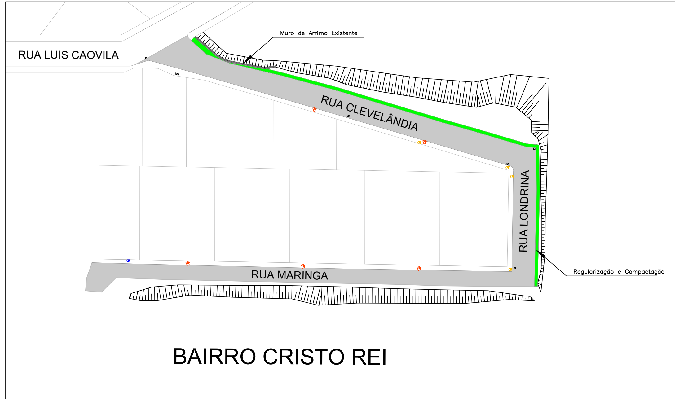
PLANTA DE TERRAPLENAGEM Esc: 1/750